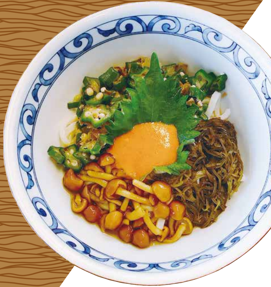
ねばねば冷やし麺 850円