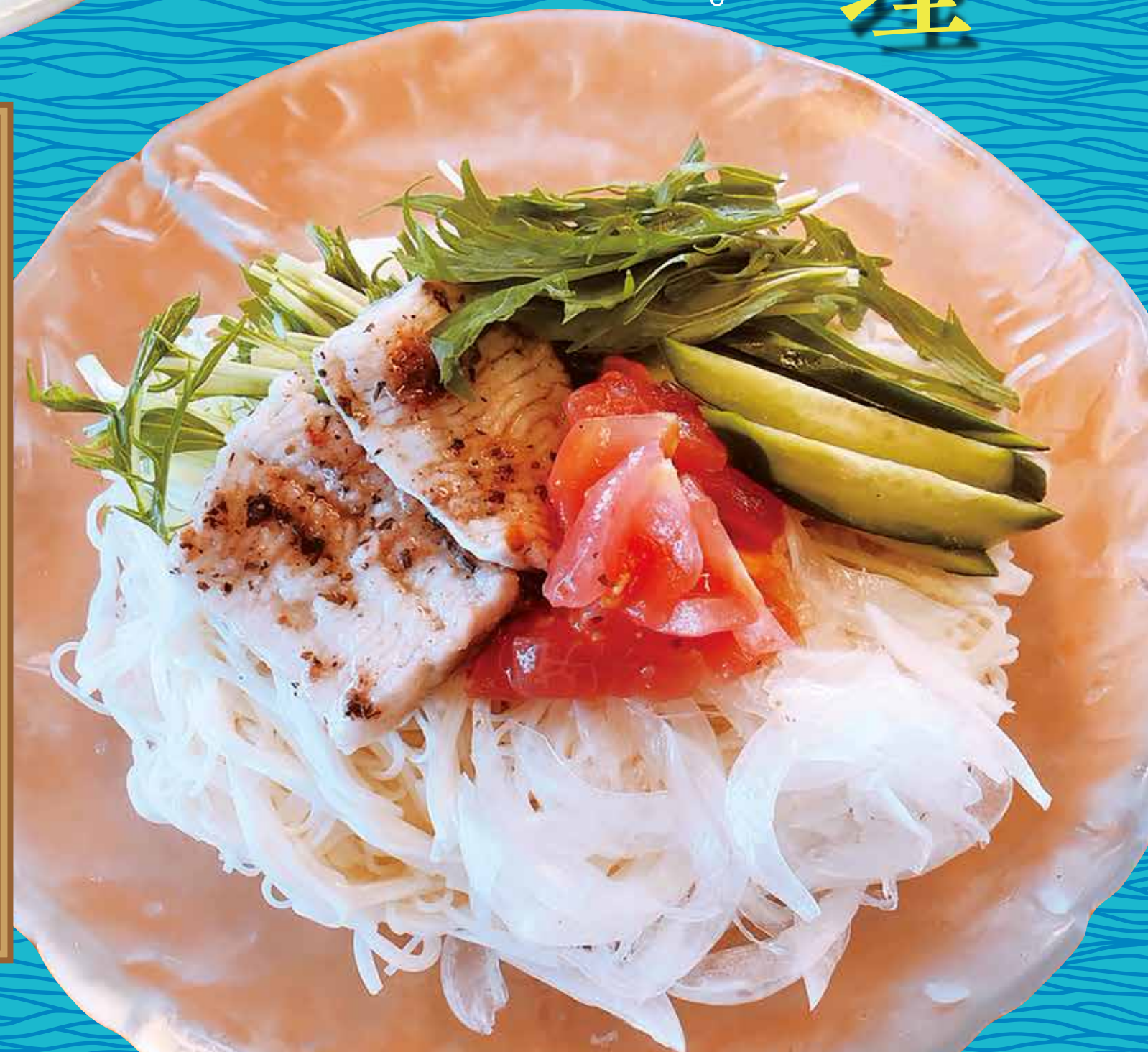
鱧のぶっかけサラダ素麺 1,000円